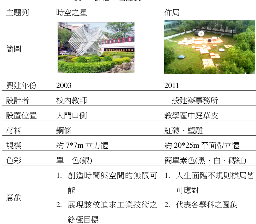
表 2 評估單位簡表